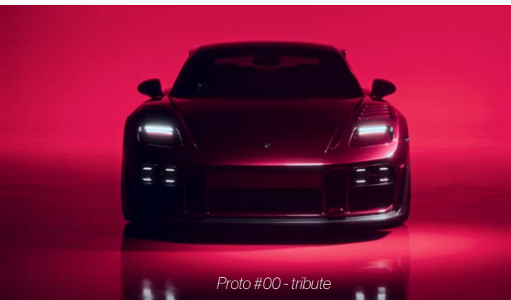
Proto #00 - tribute

L'avant dégage un tel charisme qu'il déclenche un instinct de survie primaire chez les conducteurs devant vous. Ils s'écartent instinctivement de votre chemin au moment où ils aperçoivent la bestialité de votre TURBO Spezial dans leurs rétroviseurs. Le souvenir de son passage reste mémorable et laisse une marque indélébile dans l'esprit de chaque véritable passionné de supercar qui en est témoin.